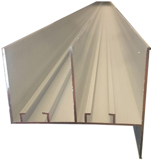
1.1 Mobilyalarda Profil