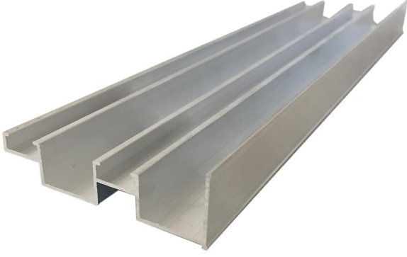
1.1 Mobilya Sürgü Sistemi Profili